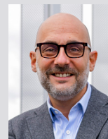
Direction communication développement durable & accompagnement des transitions Directeur : Pierre BAMBOU